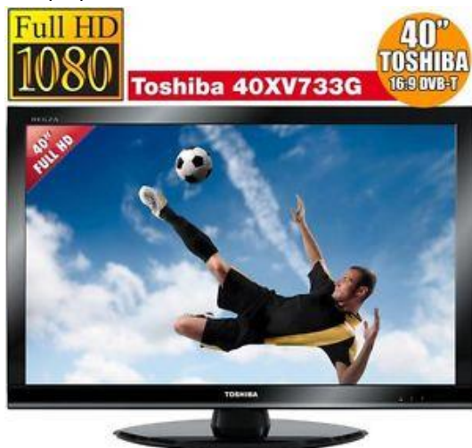
TV 40" formato 16:9